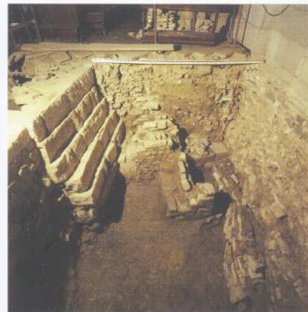
Pogled na starejše zidove, ki so sedaj predstavljeni v okviru Župnijskega muzeja v cerkvi

Probabilmente si tratta di un manufatto dell'arte funeraria.