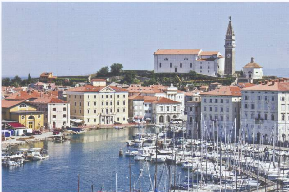
Piran s cerkvijo sv. Jurija / Pirano con la chiesa di San Giorgio