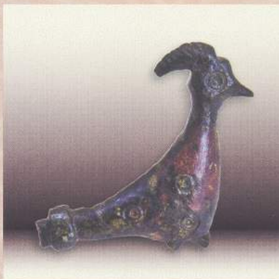
Bronasta fibula, original (ohr. velikost: 3,70 x 3,20 cm)

V 6. in 7. stoletju so fibule v obliki pava bile priljubljene med poznoantičnim staroselskim romanskim prebivalstvom v severni Italiji in vzdolž alpskega loka. V Sloveniji so bile fibule v obliki pava poleg v Piranu najdene v Celju in na Bledu, v Italiji pa v Invillinu, Concordiji, Roveretu in Villagarinu. Zelo verjetno je, da je fibula iz Pirana izdelek italske obrti, najbrž ravenske delavnice pod bizantinskim vplivom.