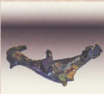
Bronasta fibula, hrbtna stran Fibula in bronzo, retro

Fibula in bronzo, originale (dimensioni cons.: 3,70 x 3,20 cm)