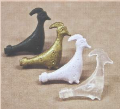
Replike pavov iz epoksidne smole je izdelal Ciril Bratuž. La replica dei pavoni in resina epossidica è stata realizzata dal Ciril Bratuž.

Della fibula zoomorfa di Pirano (fibula, -ae, f-fibbia, spilla, fermaglio, che generalmente serviva per appuntare gli elementi della veste) si sono conservati solo il corpo e la testa. E' priva di zampe e dello strascico, con una saldatura all'altezza del collo e della coda. Sul retro della fibula si è conservata la staffa che ferma l'ardiglione. Il ciuffo del capo (aigrette) è decorato con piccoli solchi probabilmente raffiguranti il movimento, mentre in altre rappresentazioni del pavone, come nel caso della fibula di Bled, il ciuffo è immobile.