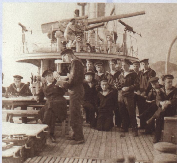
Gojenci VI. klase Pomorske vojne akademije pri pouku na ladji Dalmacija med plovbo leta 1930