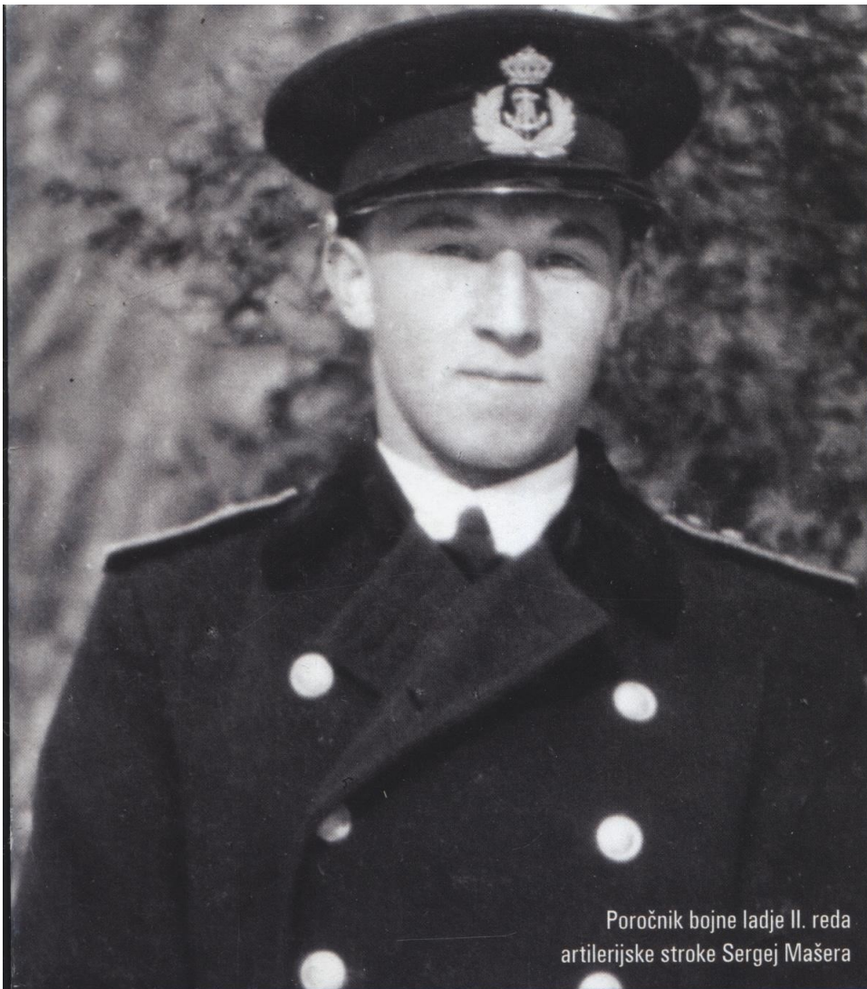
Poročnik bojne ladje II. reda artiljerijske stroke Sergej Mašera