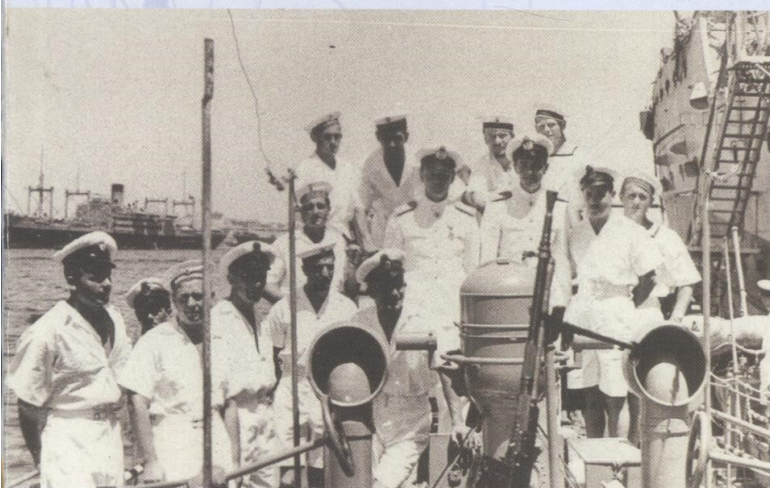
Posadka jugoslovanske torpedovke Durmitor, ki se je pridružila zavezniškim enotam, v Aleksandriji 15. junija 1941