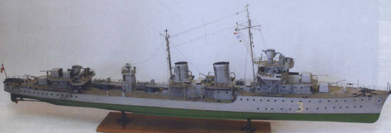
Model jugoslovanskega rušilca Zagreb (izdelal Marcel Blažina)