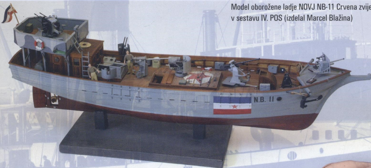
Model oborožene ladje NOVJ NB-11 Crvena zvijezda v sestavu IV. POS (izdelal Marcel Blažina)

Novembra 1944 je štab mornarice razdelil vzhodno Jadransko obalo na šest pomorskih obalnih sektorjev (POS), ki so postali osnovni nosilci bojnih aktivnosti.