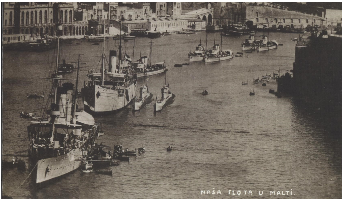
NAŠA FLOTA U MALTI.