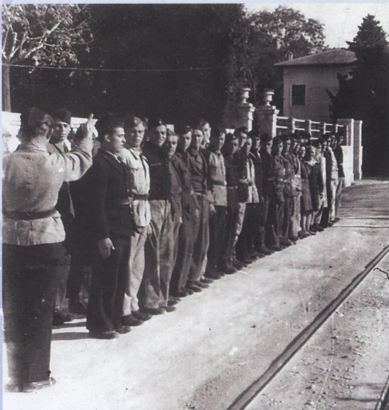
Mornariški odred Koper maja 1945

Najpomembnejši uspeh odreda je bil napad na Izolo (14.–15. april), ki so mu sledili ponoven napad na Izolo ter zavzetje Portoroža, Pirana (1. maja) in Savudrije.