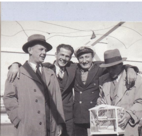
Častniki na tovorni ladji Nemanja ladijske družbe Jugolloyd leta 1936

Ladje trgovke mornarice Kraljevine Jugoslavije so bile večinoma zastarele in iztrošene. Družbe so zaradi slabega finančnega stanja kupovale plovila, ki v tujini niso bila več rentabilna, v Jugoslaviji pa so zaradi nizke cene delovne sile še prinašala dobiček. Slab zaslužek ladjarjev je vplival na slabe plače pomorščakov in na slabe življenjske razmere na ladjah, zaradi česar so pomorščaki pogosto stavkali. Zaradi velike brezposelnosti pa so ladjarji z lahkoto najemali novo delovno silo.