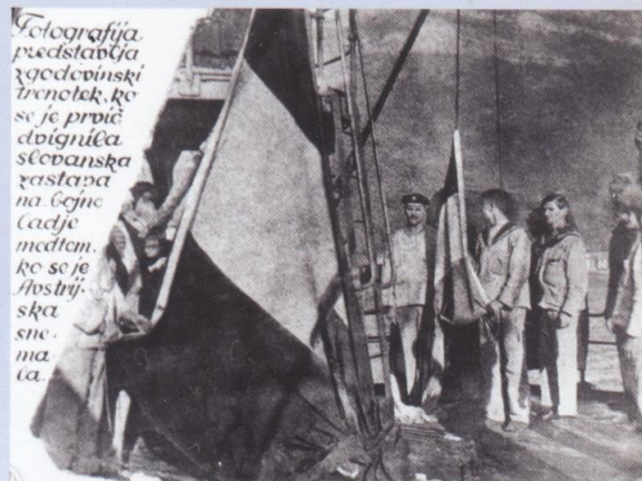
Dviganje zastave države SHS na drog arzenala v Tivtu (30. 10. 1918) po razpadu avstro-ogrske monarhije

Linjskih prog je bilo malo. Vzdrževala jih je zlasti družba Oceania. Pogostejše so bile proste plovbe. Ladje dolge plovbe so prevažale tovor pretežno za tuje države, najpogosteje premog iz Velike Britanije in brikete iz Nizozemske v Južno Ameriko, ob povratku pa žito. Zelo pogost tovor so bili poleg premoga tudi les, minerali in fosfati.