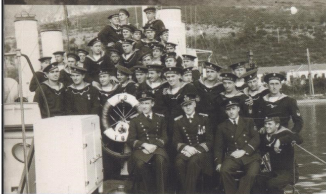
Posadka jugoslovanske torpedovke T 8 leta 1936